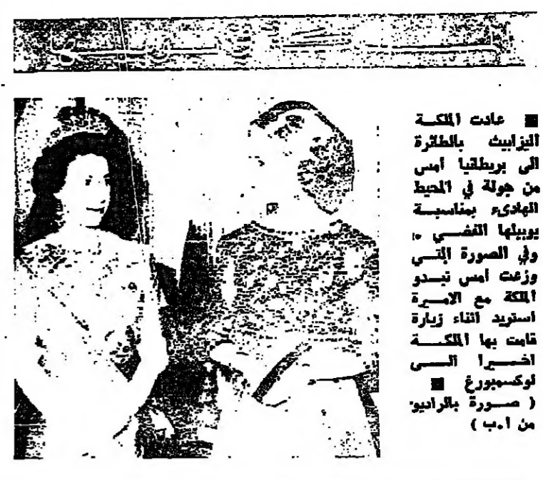
عادت الكلبة الفيزيائية بالطائرة الى بريطانيا امس من جولة في المحيط الهادئ بمناسبة يومها القومي في الصورة التي نشرت امس تسودت مع الزميلة استريد أثناء زيارة قامت بها الكلبة امس الى لوكسمبورج